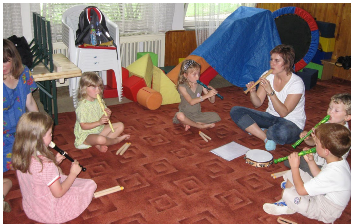
Ozdravný pobyt dětí s astmatem, podpořený ze Sasakawa Asthma Fund, prosinec 2009