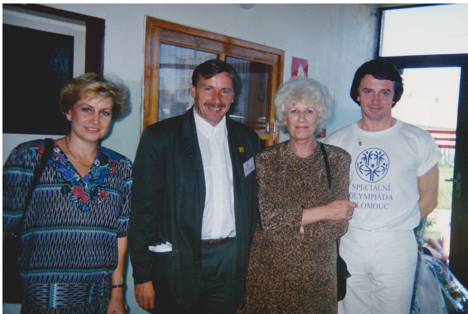
Věra Čáslavská (první vlevo) a Olga Havlová při zahájení speciální olympiády v Olomouci, červenec 1993