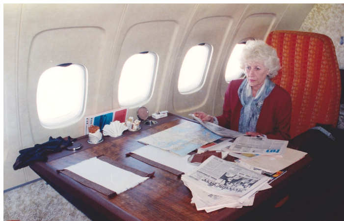
Olga Havlová při jedné ze svých četných zahraničních cest v roce 1993