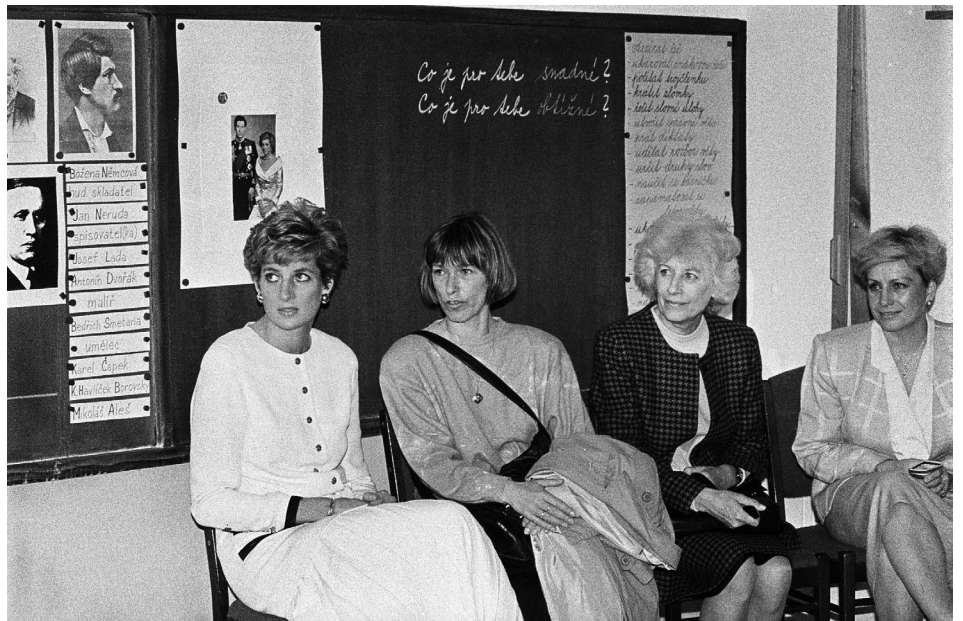
Věra Čáslavská (první zprava) spolu s paní Olgou Havlovou (druhá zprava) doprovázely princeznu Dianu při její návštěvě ČR v roce 1992 po dětských domovech, školách a ústavech

● To vám sportovní průprava přišla vhod! To ano, to jsem ještě byla v kondici. Přestože jsme litali po chodbě, vládla tam přátelská atmosféra a souznění duší. Na sebe jsme