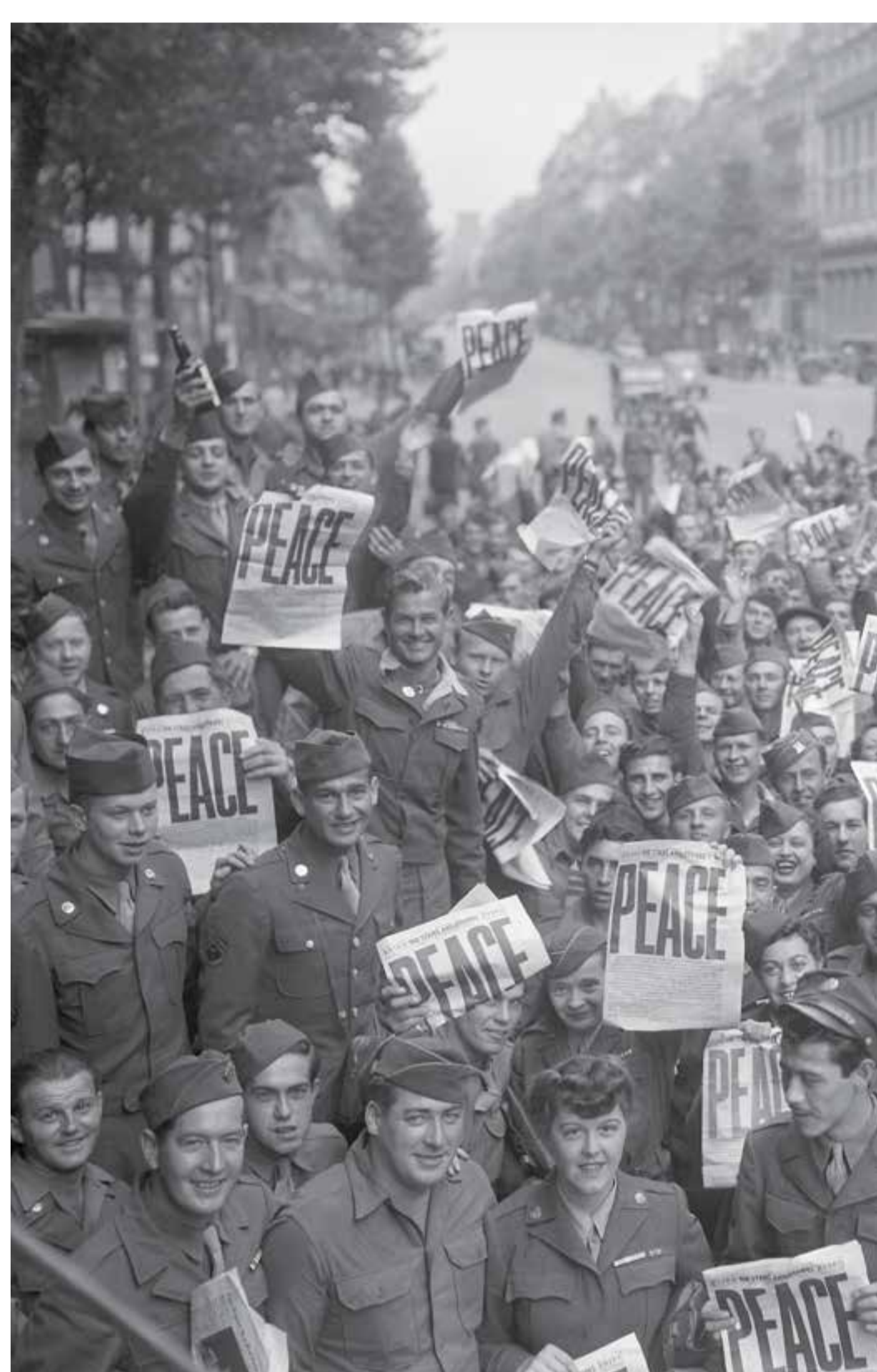
Američtí vojáci oslavují kapitulaci Japonska, Paříž

HEDA MARGOLIOVÁ-KOVÁLYOVÁ, NA VLASTNÍ KŮŽI