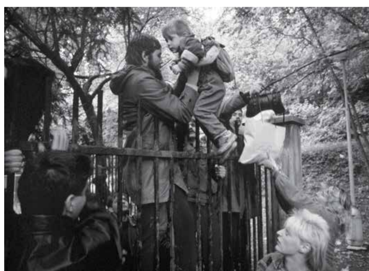
Východoněmečtí uprchlíci u plotu německé ambasády v Praze