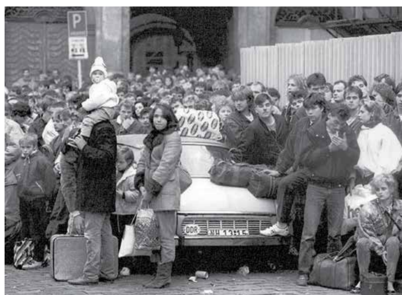
Východoněmečtí uprchlíci v ulicích Prahy