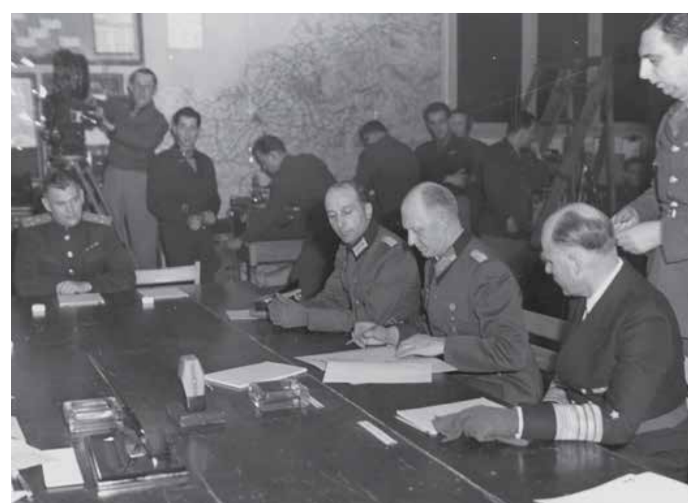
Alfred Jodl podepisuje bezpodmínečnou kapitulaci Německa, 7. května 1945, Remes