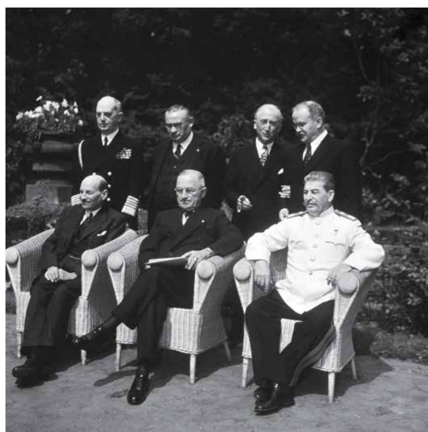
Attlee, Truman a Stalin na konferenci v Postupimi, červenec 1945

VÁLKA ROZVRÁTILA DOPRAVU A KOMUNIKACE. REGIONÁLNÍ EKONOMIKY ROZBILA, OBCHOD SE TEPRVE ZAČÍNAL ZNOVU STAVĚT NA NOHY. A PŘECE, PŘES VŠECHNY STRAŠLIVÉ OBRAZY ZKÁZY, KTERÉ MĚLI TAKŘKA VŠICHNI PŘED OČIMA, MĚLI LIDÉ PO LETECH POCIT, ŽE MOHOU ZAČÍT ZNOVU, ŽE SI BUDOU MOCI USPOŘÁDAT ŽIVOT PODLE TOHO, JAK SI PŘEDSTAVUJÍ. DOUFALI, ŽE O POLITICKÉM USPOŘÁDÁNÍ A ZPŮSOBU ŽIVOTA V ZEMÍCH, V NICHŽ ŽILI, BUDOU ROZHODOVAT SAMI ČI PROSTŘEDNICTVÍM TĚCH, KTERÉ SI ZVOLÍ. NADĚJE MNOHÝCH SE NAPLNILY, ALE NADĚJE MNOHÝCH JINÝCH NIKOLI.