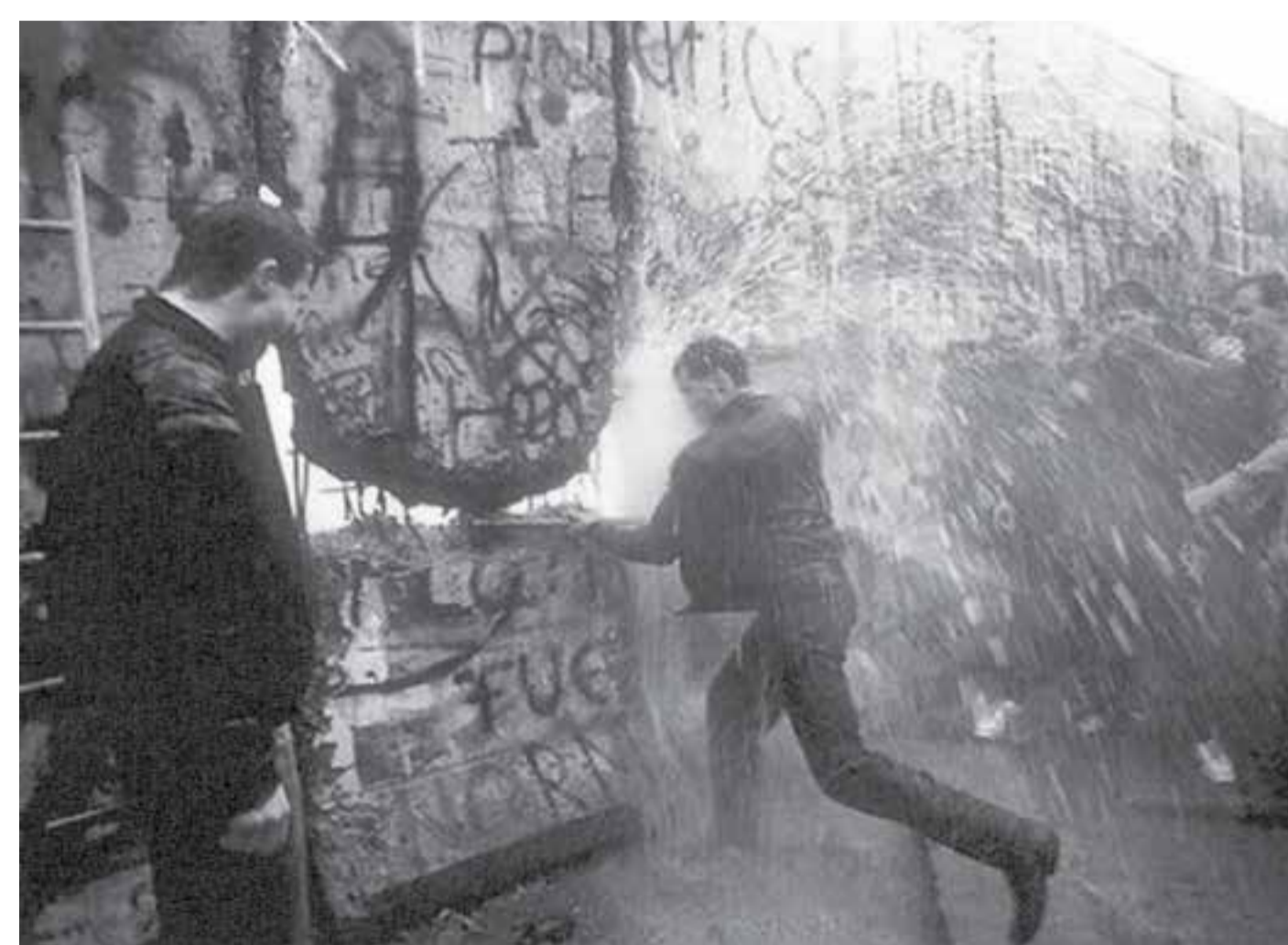
Slavná fotografie bourání berlínské zdi