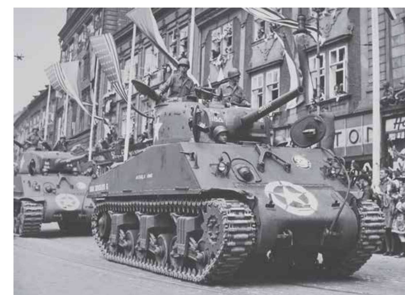
Američtí vojáci v ulicích Plzně, květen 1945

Druhá světová válka skončila bezpodmínečnou kapitulací poraženého Německa. I v té kapitulaci se však už odrážel začátek nového uspořádání Evropy: dokument o kapitulaci byl podepsán 7. května v Remesí, ale protože sovětský vůdce Stalin měl pocit, že kapitulace složená do rukou západních Spojenců dost nezohledňuje nezpochybnitelné zásluhy SSSR na válečném vítězství, podepsali jiní němečtí představitelé kapitulaci znovu v sovětském hlavním stanu v berlínském Karlshorstu. A tak se konec války desítky let připomínal na Západě 8. května, kdežto na Východě 9. května.