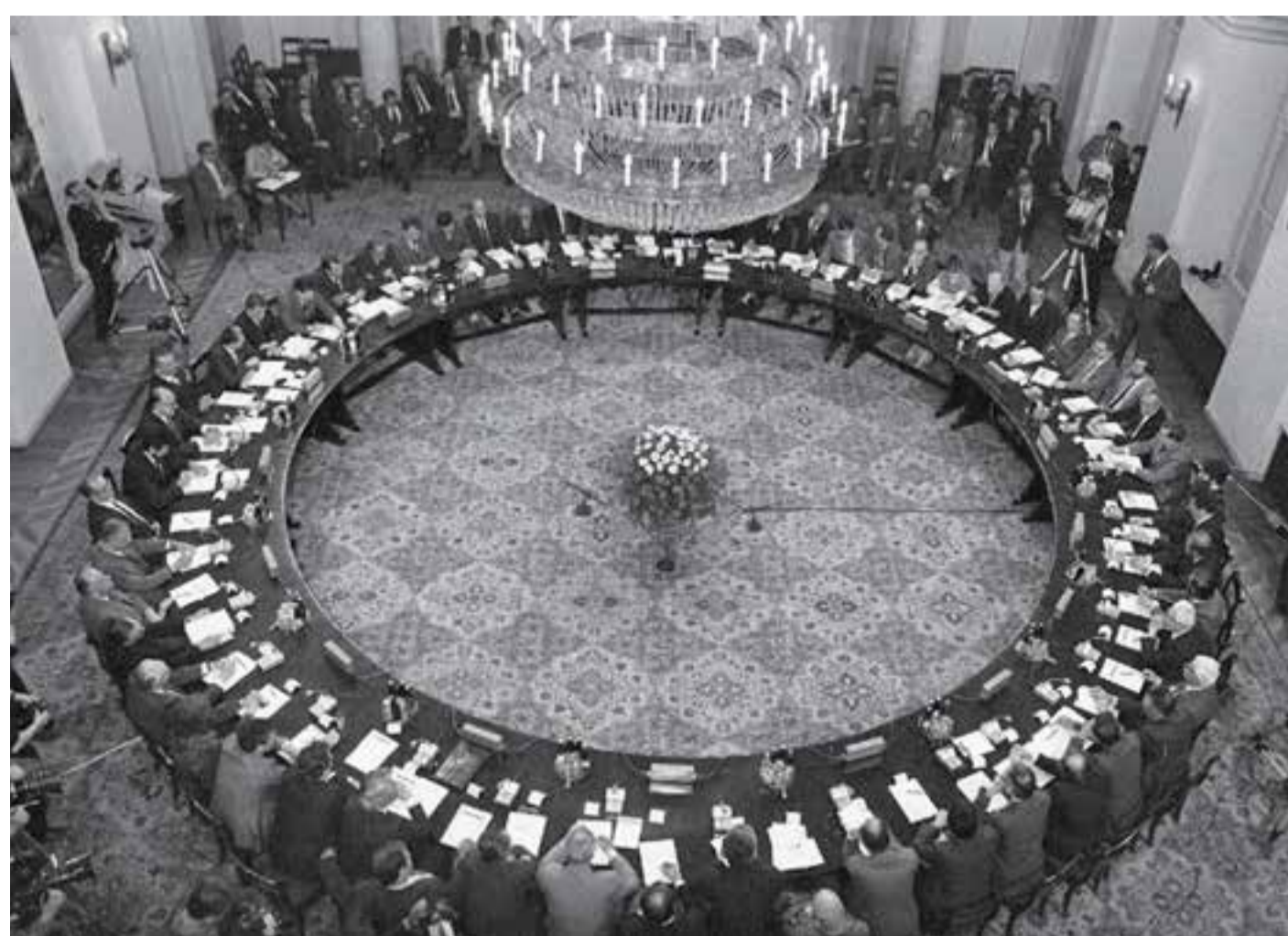
Jednáni vlády s představiteli opozice u kulatého stolu v Polsku

1945–1949: Padá železná opona 1950–1954: Horká studená válka 1955–1959: Západní Evropa se sjednocuje 1960–1964: Rovnováha strachu 1965–1969: Mláďi se bouří 1970–1974: Klid? Jen v Evropě 1975–1979: Pokusy o uvolnění 1980–1984: Druhá studená válka 1985–1989: Kolaps východního bloku