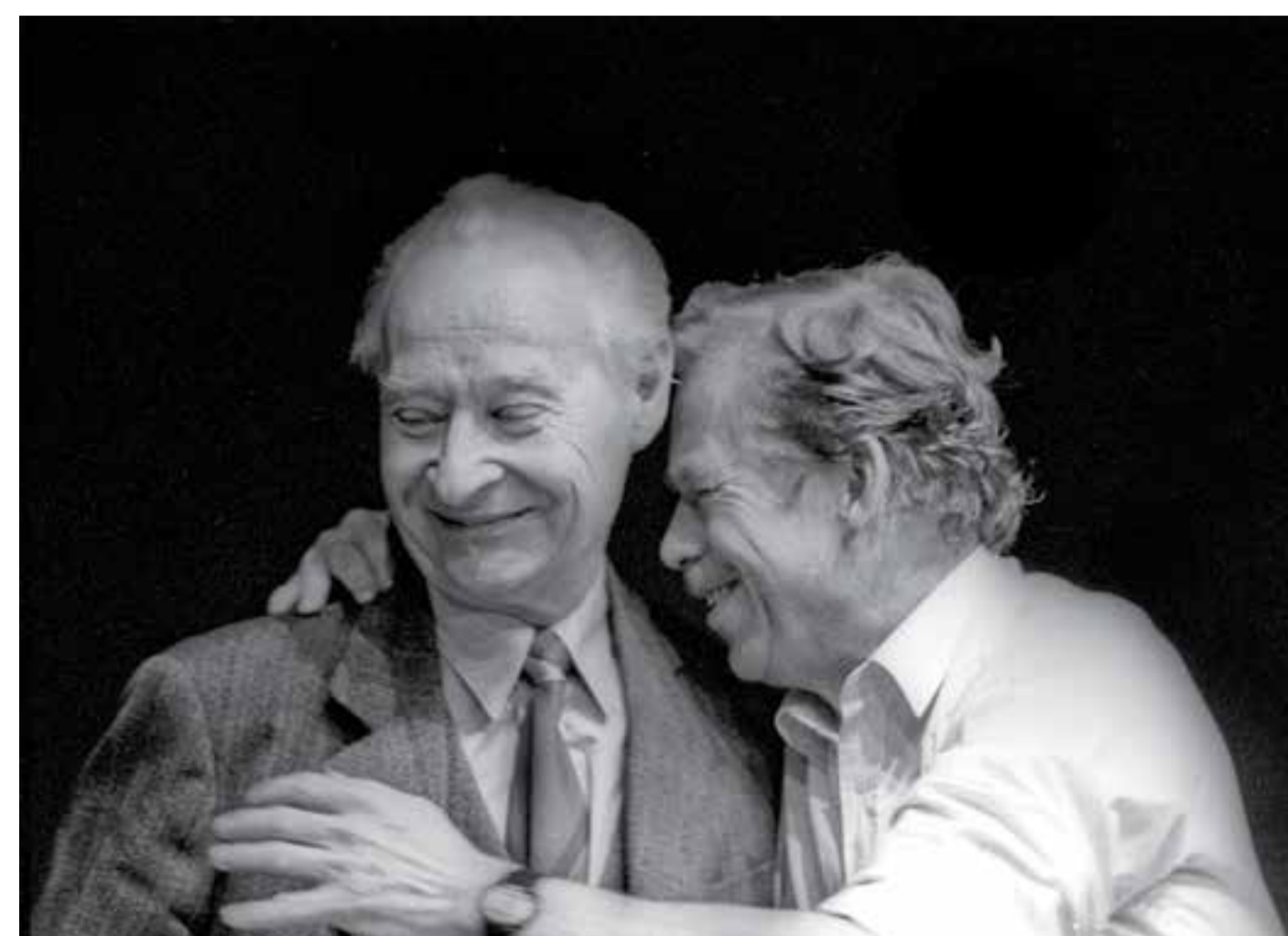
Alexander Dubček a Václav Havel v divadle Laterna magika