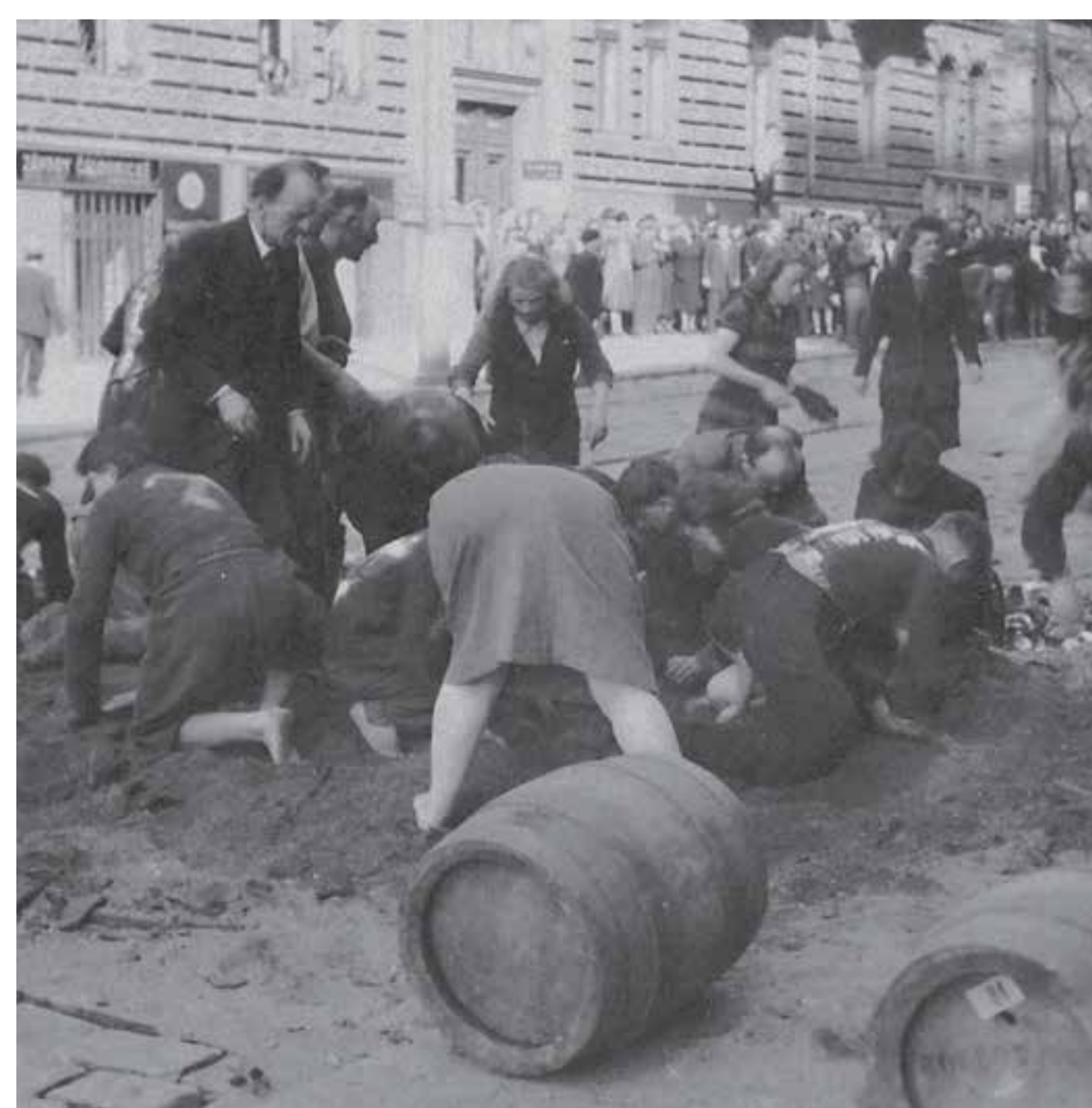
Zajatí němečtí vojáci a civilisté odklízí barikády v ulicích Prahy