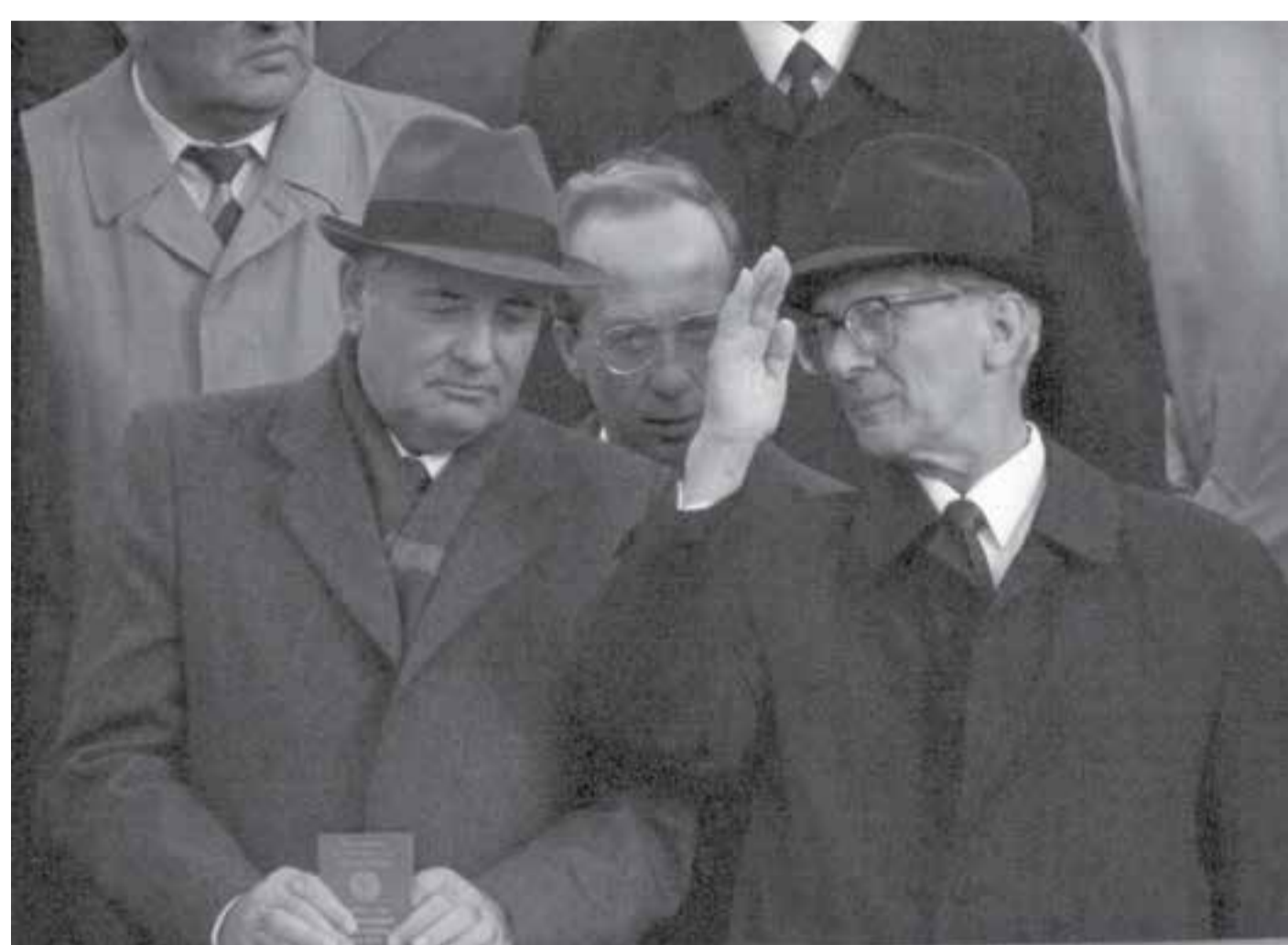
Michail Gorbačov (vlevo) a Erich Honecker během oslav 40. výročí vzniku NDR