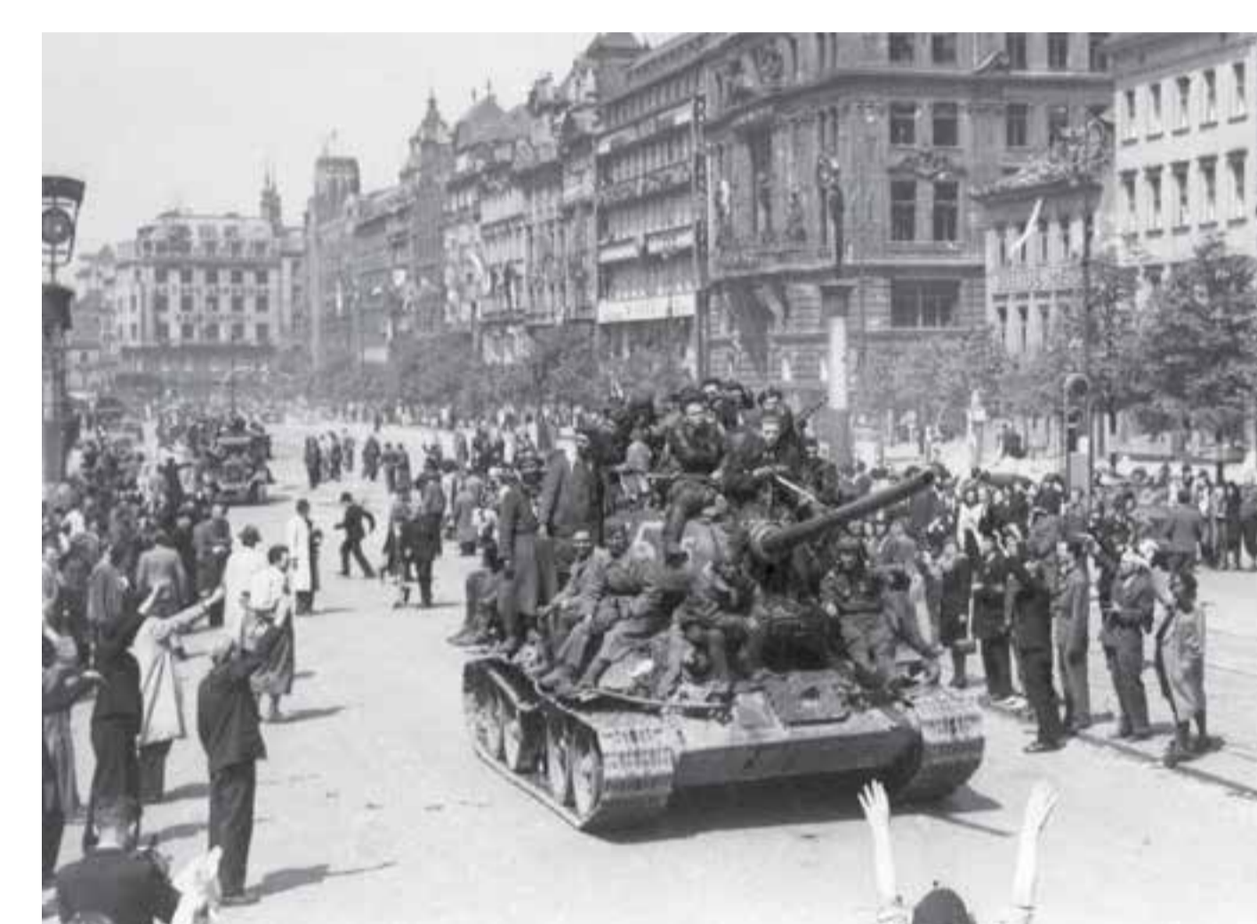
Obyvatelé Prahy vítají na Václavském náměstí vojáky Rudé armády, květen 1945