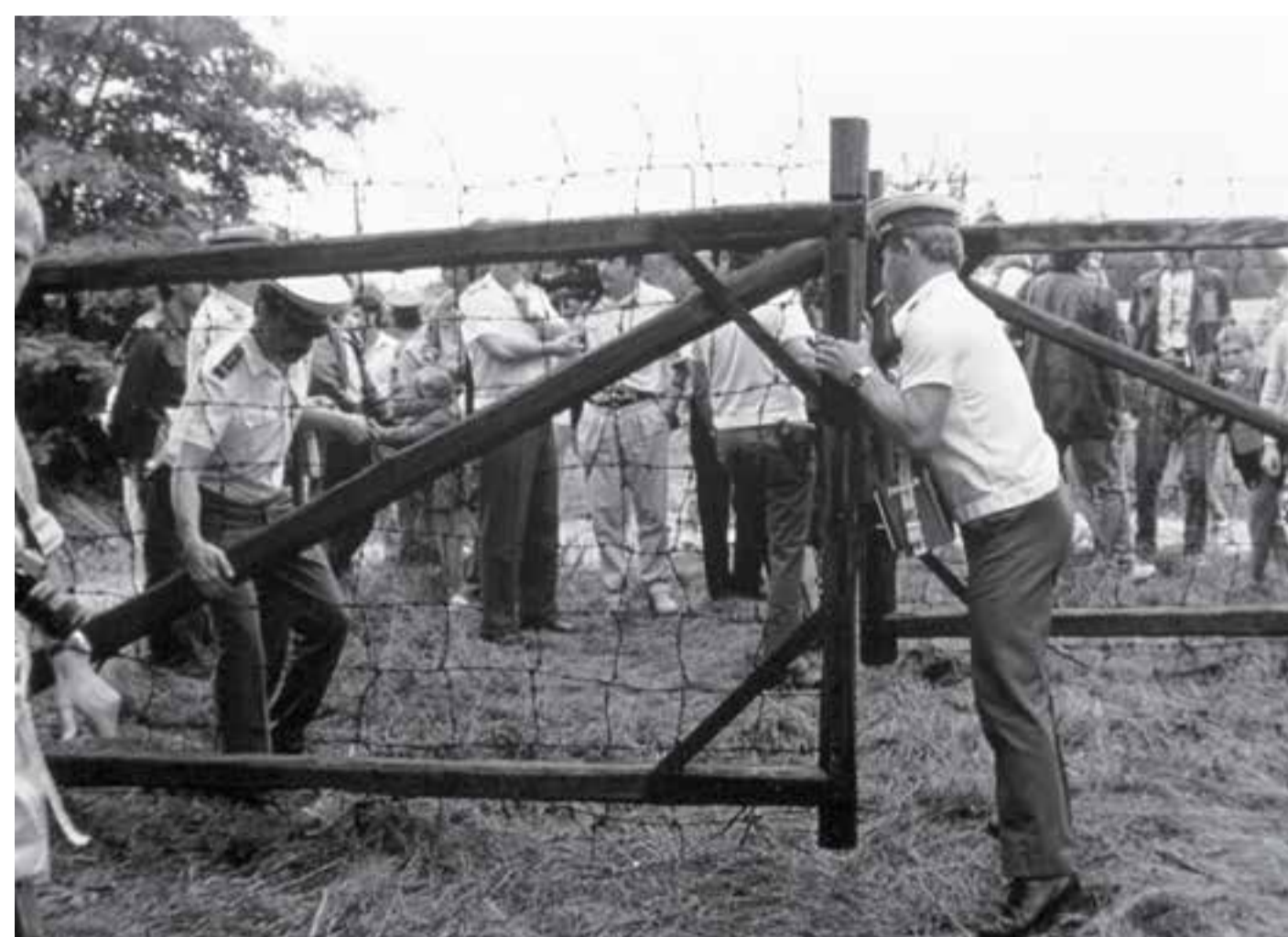
Panevropský piknik – otevření hranic mezi Maďarskem a Rakouskem