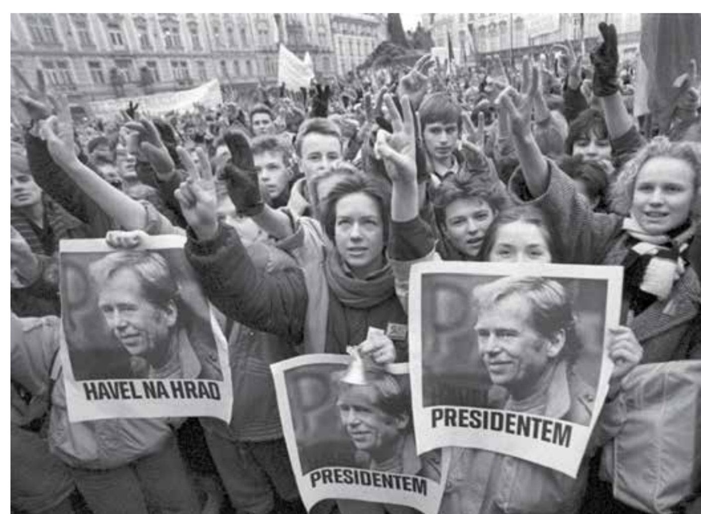
Praha, Staroměstské náměstí