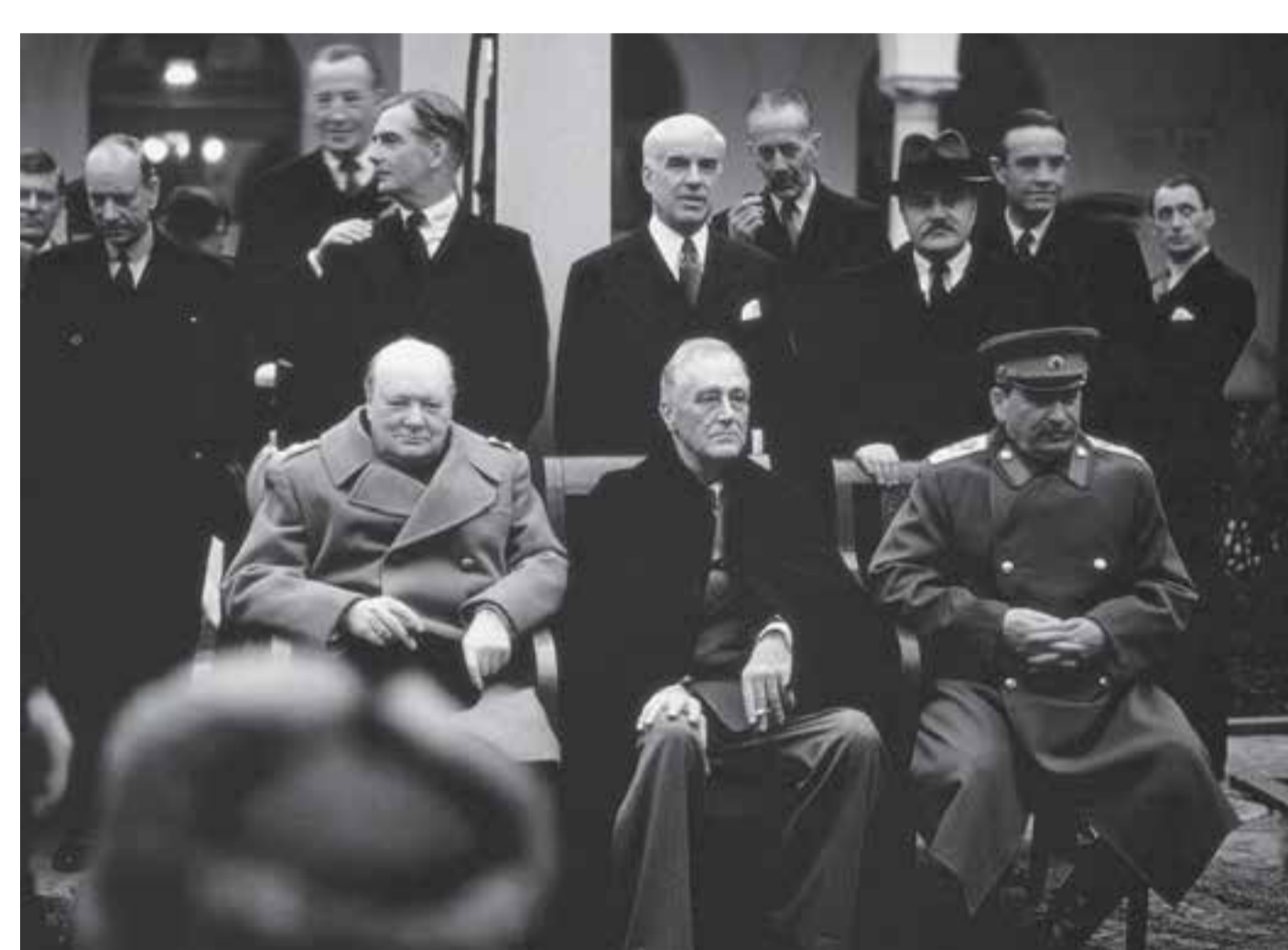
Churchill, Roosevelt, Stalin na konferenci v Jaltě, únor 1945