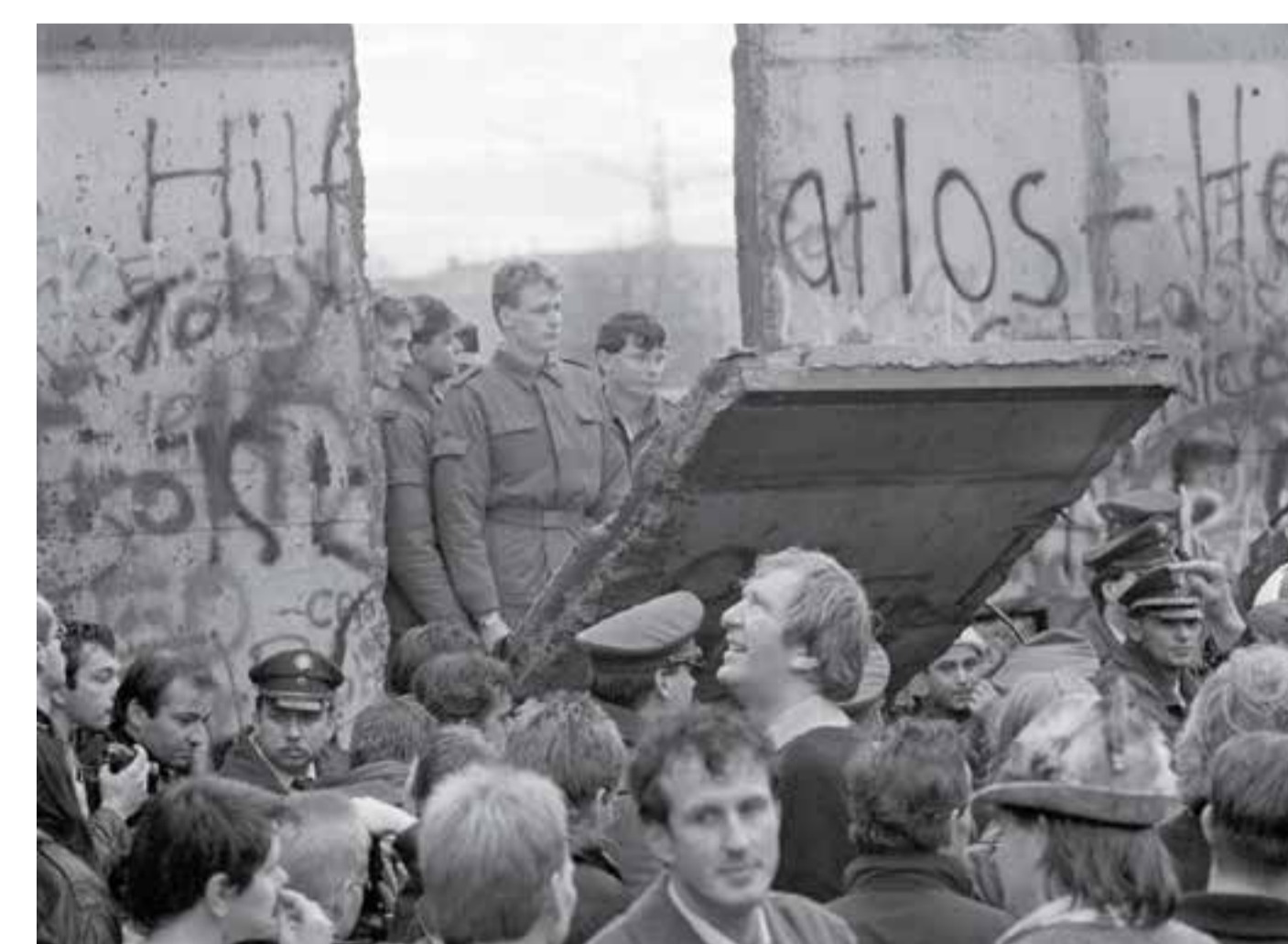
Pád Berlínské zdi

... HISTORIK TONY JUDT V ROCE 2005 V KNIZE POVÁLEČNÉ DĚJINY NAPSAL: